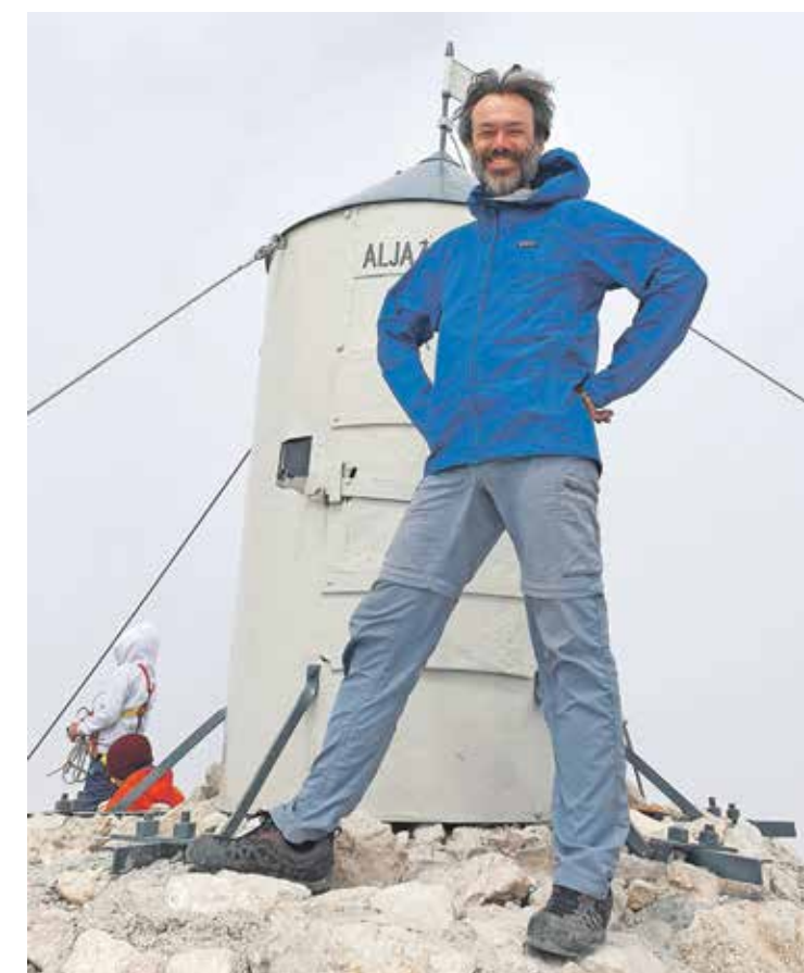
Obvezna fotografija z vrha slovenskega očaka