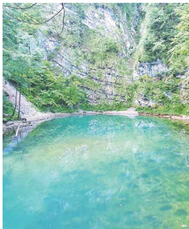
Slavno in skrivnostno Divje jezero pri Idrijci