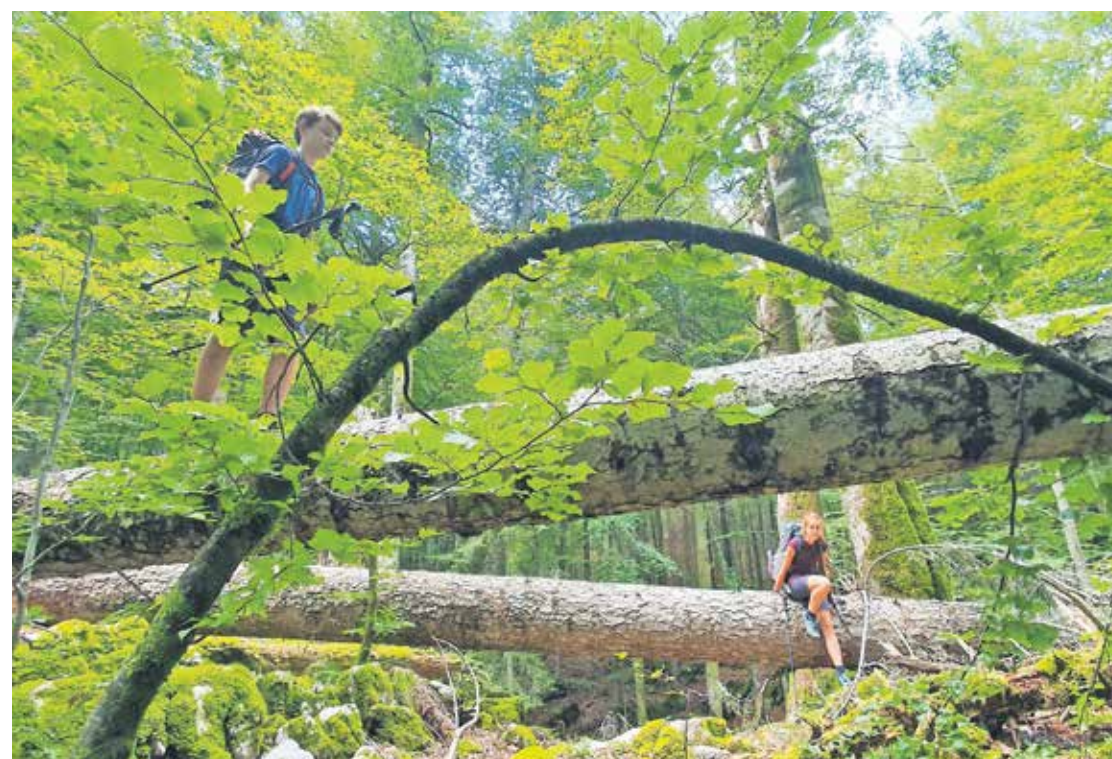
Mladi planinski podlasici trasirata pot po Kočevskem rogu.